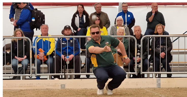
L'Angérien a disputé le championnat du monde au Danemark en 2022.